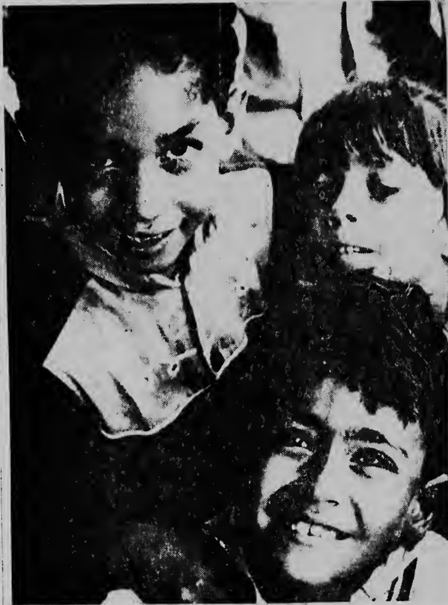
Muchanan di e bewaarschool na Brazil, kendenan tambe ta anhela pa dreña den un local mas adecuado y higiénico. Duna nan un chens.